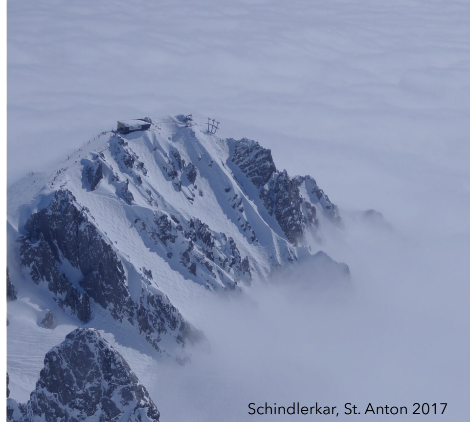
Schindlerkar, St. Anton 2017

und unterstütze regional sozial Schwächere, aktuell als Präsidentin von LIONS Aschheim.