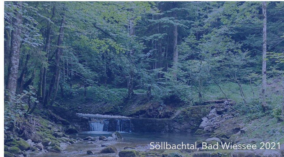
Söllbachtal, Bad Wiessee 2021